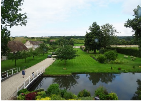
Le vue vers l'Ouest depuis le manoir