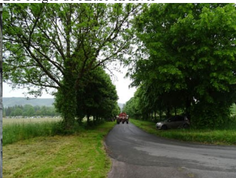
Les parties plantées dans la commune