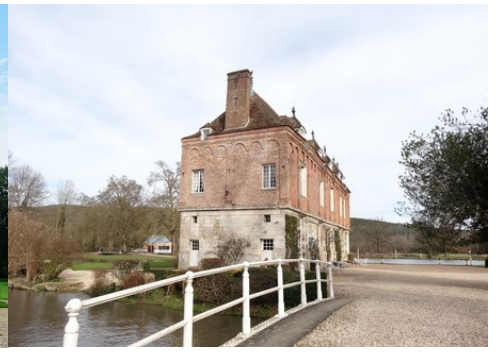
Le manoir vu depuis le pont