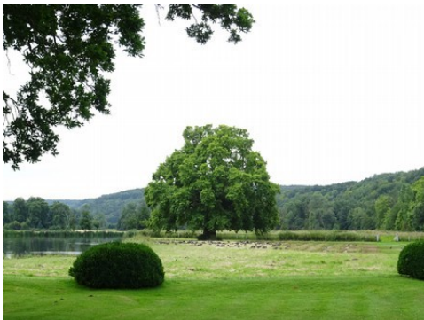
Les prairies et étangs aux alentours

Les avis seront cohérents avec ceux émis ces dernières années, à savoir : pas de maisons à volume compliqué (type V, W, Y, ou Z), pentes à 45° pour les volumes principaux, ardoise ou tuile plate de teinte brun vieilli, à 20u/m 2 , avec un débord de toiture de 20cm, enduit de teinte beige clair avec modénatures (au choix : chaînages, encadrement de fenêtres, soubassement, colombage...). *Voir les autres fiches.