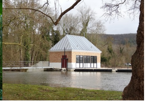
La petite centrale hydraulique du manoir