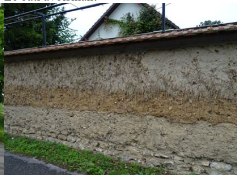
Les murs en bauge