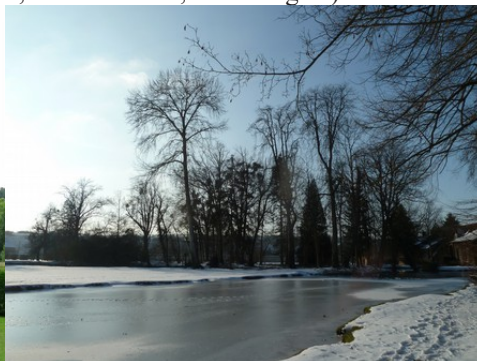
Les berges de l'Eure en hiver