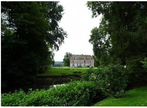
La façade nord (vue éloignée)