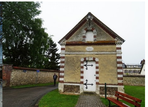
Le bâti avoisinant