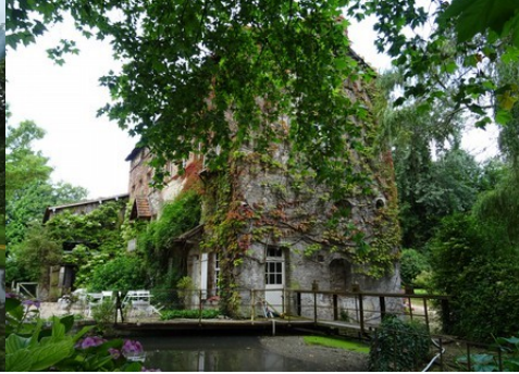
L'ancien moulin du manoir