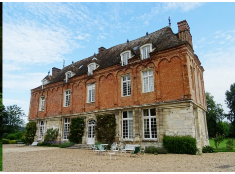
La façade sud du manoir